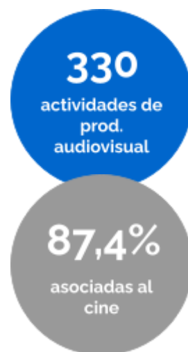
Gráfico 1. Actividades de contenido audiovisual, por tipo de contenido. Año 2023.

Información audiovisual correspondiente al año 2023.